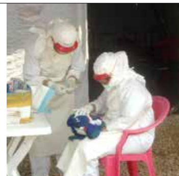
I felt: Artikkelforfatter arbeidet en periode ved Røde Kors sitt behandlingssenter for ebola i Siera Leone.

kommet inn med ambulanse for mer enn to uker siden. Hun hadde vært ved klinikken vår, IFRC Kenema, i mer enn to uker. To drøye uker i området for høyrisiko. Store deler av tiden hadde det vært andre pasienter der også. Men de som jobbet der var alle kledd i fullt beskyttelsesutstyr. Eller hun måtte snakke til dem over gjerdene.