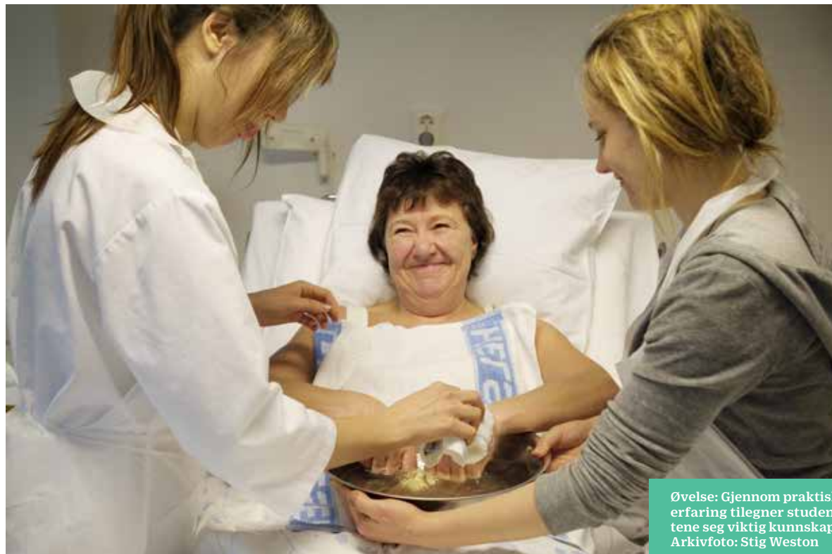
Øvelse: Gjennom praktisk erfaring tilegner studentene seg viktig kunnskap.

Etter samarbeidsprosjektet utarbeidet høyskolen en øvingsbok med oversikt over praktiske ferdigheter i sykepleie. Hensikten var å styrke innlæringen av praktiske ferdigheter og tydeliggjøre læringsutbyttet for studentene og praksisstedet (12). Øvingsboken inneholder en systematisk oversikt over aktuelle praktiske ferdigheter studentene kan møte i praksisstudiene, når de kan forvente å møte disse og om ferdigheten kan læres i praksis eller i høyskolens øvingsavdeling. Under