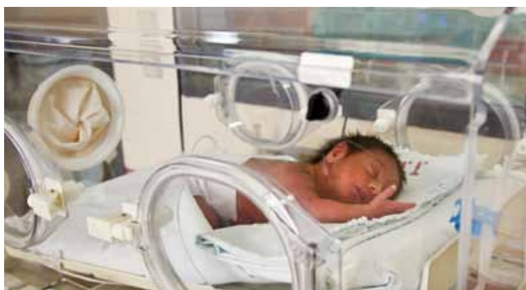
OVERRASKENDE FØDSEL: En bulgarsk mor på 18 år visste ikke at hun var gravid og kom til sykehuset på grunn av smerter. Hun fødte en velkapt gutt vaginalt, og ble på sykehuset i to dager før hun måtte hjem til sin familie. Hun kom senere for å hente gutten hjem.