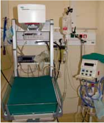
UTSTYR: Prematuravdelingen på St. Georges, bare for de nesten fullbårne.

det ett og et halvt døgn i strekk, bare avbrutt av fire timers søvn.