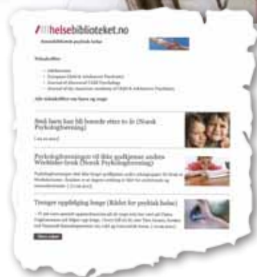
HESEBIBLIOTEKET: Nettstedet har egen ressursamling for psykisk helse.

Prøv «PubMed – fulltekst» via Helsebiblioteket. Skriv «lamotrigine» og «hypersensitivity» i søkefeltet. For å finne oversiktsartikler velger du «review» i høyremargen. I PubMed klikker du på «Helsebiblioteket fulltekst»-ikonet ved siden av artikkel-