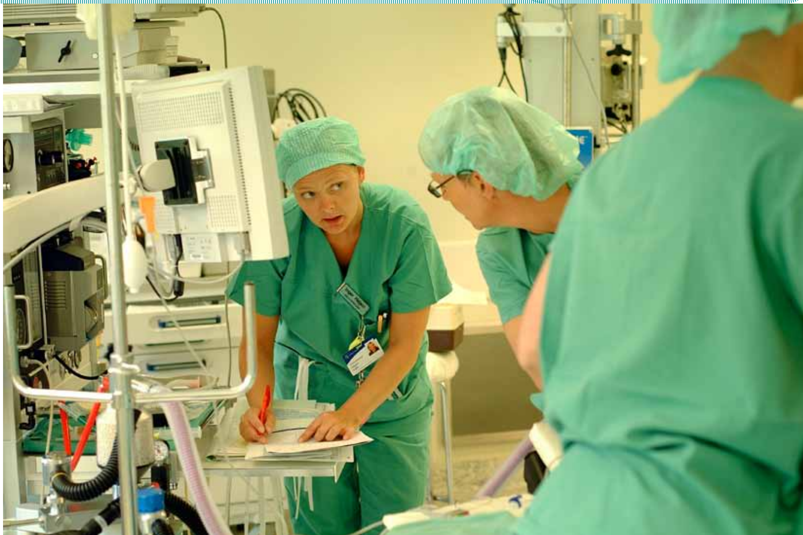
VARIERENDE: Overleger og kirurger opplever 100 prosent støtte i operasjonsteamet, mens operasjonssykepleierne var den gruppen i undersøkelsen som mente samarbeidet i teamet fungerte dårligst.