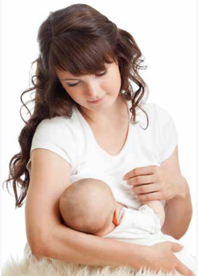
AMMING: I enkelte tilfeller har ammeproblemer ført til for eksempel manglende glede i morsrollen.

Kunnskapsbasert praksis innebærer å sette elementene i modellen (figur 2) sammen i praksis, i møter med individuelle brukere. En helsesøster som arbeider kunnskapsbasert integrerer kunnskap fra forskning sammen med sin erfaringsbaserte kunnskap, sine ferdigheter og brukernes ønsker. Likeledes er det viktig å vurdere konteksten det foregår innenfor. Det betyr at den samme forskningsbaserte kunnskapen kan føre til ulike beslutninger i ulike settinger. Til tross for at oppsummert forskning viser at amming er gunstig, kan praksis likevel variere. En mor som får gjentatte brystbetennelser vil sannsynligvis få ulik veiledning i ulike kontekster (får barnet nok melk, har mor avlastning, får mor redusert omsorgskapasitet, har mor lite plager) og i ulike kulturer (for eksempel Norge, India, England). Den beste beslutningen vil variere fra familie til familie og fra kontekst til kontekst. Å syntetisere forskning, erfaring og brukermedvirkning i den gitte situasjonen (konteksten) krever anvendelseskompetanse. Helsesøster må kunne sette modellen for KBP sammen. Dynamikken i konseptet er at det kreves skjønns ved bruk av de ulike kunnskapskildene.